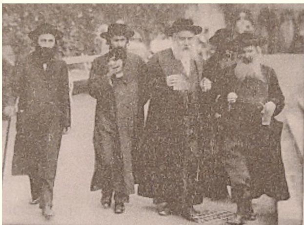
תמונה האיך שהרה"ק בעל מנחת אלעזר זי"ע בהיותו במאריבאנד שותה מעומד